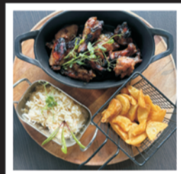
SKRZYDEŁKA W POWIDŁACH