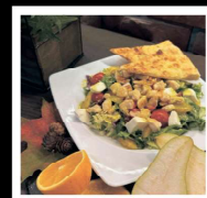
SAŁATKA Z POMARAŃCZĄ