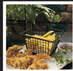
DANIA DLA MALUCHA