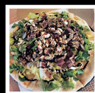
MEGA SAŁATKA CZERWONY BURACZEK